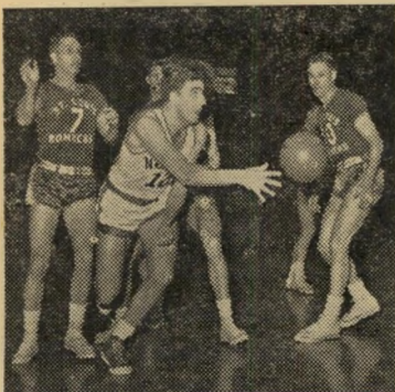
מדיסון סקוויר: כדורסל הודות לשערוריה — פרסומת

מספר הכרישים הבוגרים. הסיבה: ציידים שאינם נרתעים מימי עבודה ארוכים וקשים צוברים גופות כרישים, קושרים אותן לדפינות, ספינותיהם.