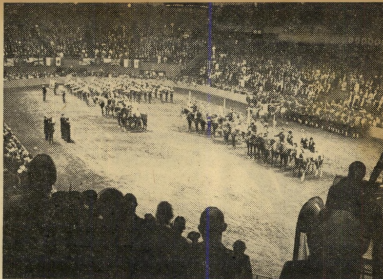
מדיסון סקוויר: תצוגת סוסים באספה ציונית — שיא חדש

בראשית יולי מופיעים תינוקי כרישים (אורכם: 2 מטרים), אך אותה שעה מתמעט