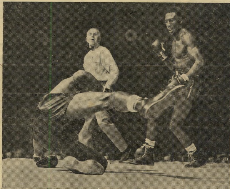
מדיסון סקוויר: סוני בר מפיל את שוגר ריי רובינסון אחרי ההצגה — קילוח מים חמים

תחרויות ההתאגרפות נערכות במשך כל השנה, מושכות קהל צופים רב, העוקב בלהיטות אחר 12 הסיבובים ויותר המהווים התחרות.