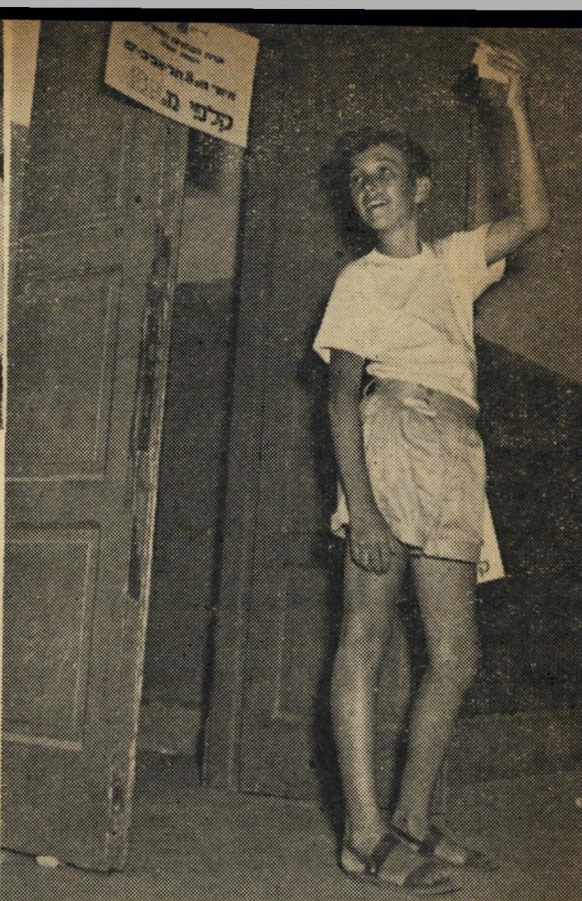
הנער העיברי: המפלגות משלמות. אפשר להרויח.