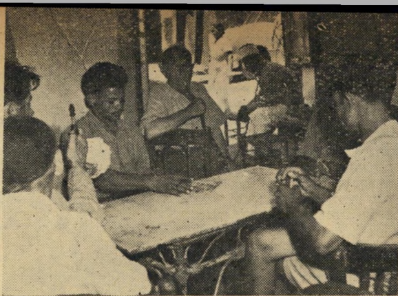
יפו: ערבים בוחרים ומשחקים קלפים.