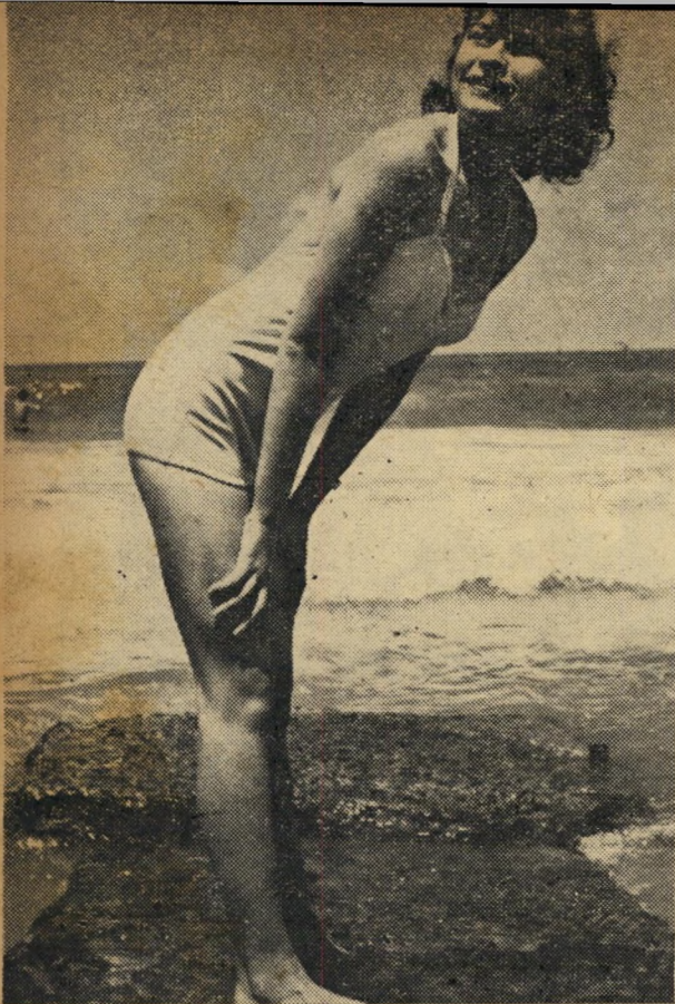
הנערה המשתעשעת: המפלגות אינן מענינות. אפשר להתרחץ.