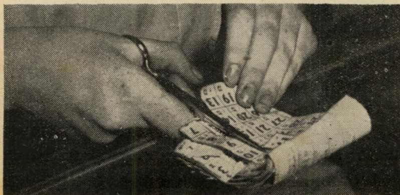
כן: ק/4, מ/4, א/8, פ/4. לא: ד/3, צ/10, ח/7.

9. האם אתה חושב שהצנע, הקיצוב והפיקוח דרושים בתקופת קיבוץ הגלויות?