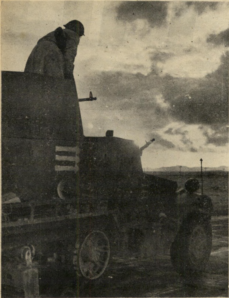
כן: מ/5, ח/15. לא: ק/4, מ/4, פ/4, ד/4, צ/4.

7. האם אתה בעד זה שנחדש את המלחמה בערבים כדי להזיז את גבול המדינה עד לירדן?