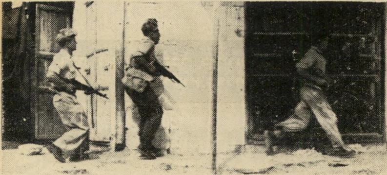
כן: ח/20. לא: ק/4, מ/4, א/4, פ/3, ד/3, צ/2.

8. האם חושב אתה שהאנגלים יצאו את הארץ הודות למלחמתם של הארגון הצבאי הלאומי ולח"י?