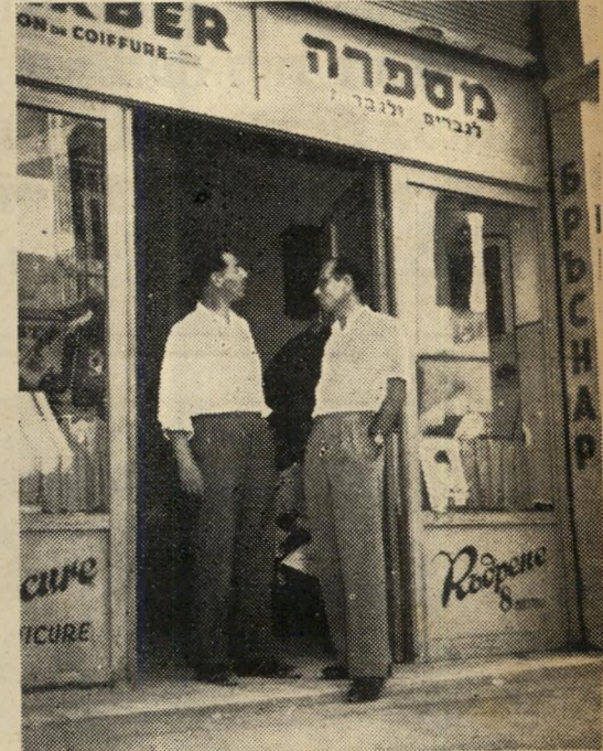
כן: פ/3, ד/3, צ/7, ח/7. לא: ק/4, מ/8, א/8.

5. האם אתה מאמין שהיזמה הפרטית היא שקלטה את העליה?