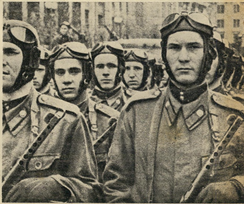
כך: 15/ק, 5/מ. לא: 4/א, 4/ב, 4/ד, 4/ז, 4/ח.

2. האם היית רוצה שנקבל בידדות את פני הצבא הארום אם יפלוש לארץ במלחמת עולם?