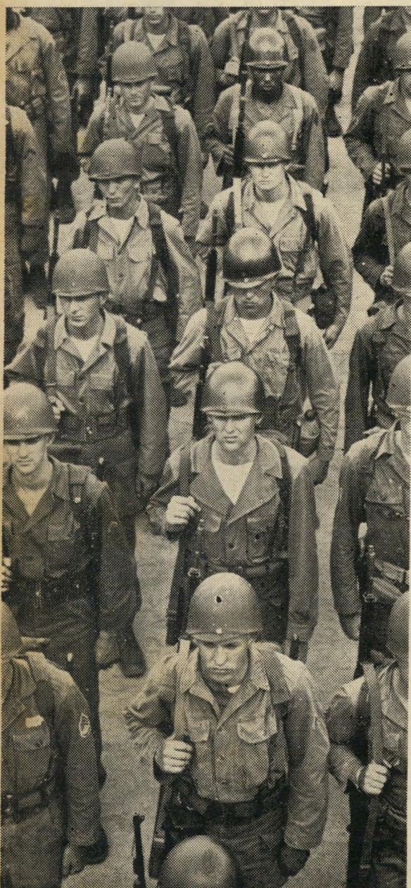
כך: 4/א, 4/ב, 4/ד, 4/ז, 4/ח. לא: 5/ק, 15/מ.

2. האם היית רוצה שנקבל בידדות את פני הצבא הארום אם יפלוש לארץ במלחמת עולם?