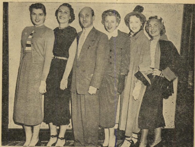
הדוגמניות של הדסה בתצוגת טורונטו 60 קצא אורחים ליום

אנשי מגן-דוד-אדום, הרגילים למקרים כא' לה המפיקים את שיעורם משמרת הלילה, חיכו לטוף הסיפור. הוא בא בצורה בלתי צפויה: הנושך החל מלטף את השרוטה, סירק את שערותיה שהתפרעו. כעבור חצי שעה יצאו יחד את התחנה, שלובי זרוע.