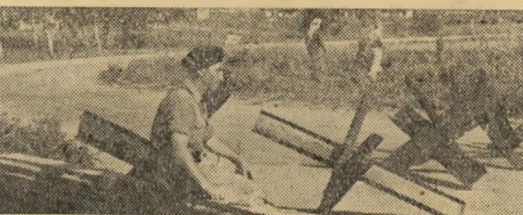
דרך ג': לא שלום, לא מלחמה