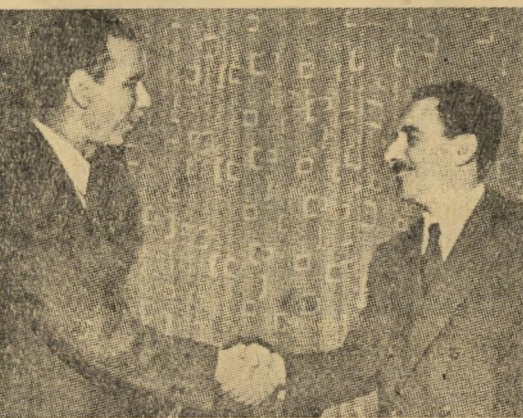
דרך ב': שלום לשם התבססות