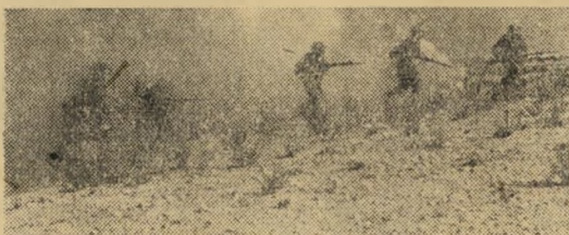
דרך א': מלחמה לשם כיבוש

שיוון זכויות גמור: קו המבוסס על ההנחה שערביי ישראל, אם ייקלטו במדינה מבחינה כלכלית, חברתית ותרבותית, יכולים לשמש גשר בין ישראל וארצות ערב, יגבירו את סיכויי השלום בין המדינות. מטעמים שונים דוגלים בקו זה: הקומוניסטים, וכפוף להסתייגות הנזיל, סיעת הרוב של מפ"ם.