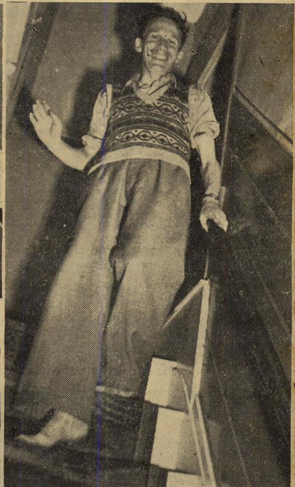
במוצאי, חדר לנפש. רמת חיי הפועל הישראלי אינה שונה בהרבה מזו של הפועל האנגלי, מלבד: שיכון. שעה שפועל ישראלי נאלץ, לעתים קרובות, לצופף משפחה בת שלוש, ארבע נפשות בחדר או שנייה גרות חמש נפשות בית פלסטר בבית דו' קומתי, בעל ארבעה חדרים, המופרדים על ידי מדרגות המובילות מחדרי המבוגרים לחדר הבנות והמסבא.