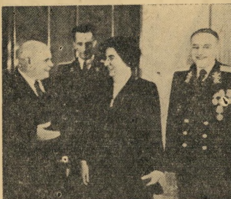
הפנים לרוסיה: גולדה במוסקבה.

המערב לידי הבריטים, אשר רוב הישוב ענדו זוכר להם שנאת-נעורים, ביחוד בענייני צבא. הצטרפות למחנה הסובייטי: היתרון: מצב נוח יותר לאוכלוסית המדינה במקרה של פלישה סובייטית, שמפקדיה יתחסו בעדינות רבה יותר