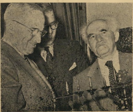
הפנים לאמריקה: בני-גוישי-נפט.

הבוחר הישראלי חייב בהחלטו על בעיה זו, לשקול היטב את המעלות והמגרעות, של הצטרפות לאחד משני הגושים: