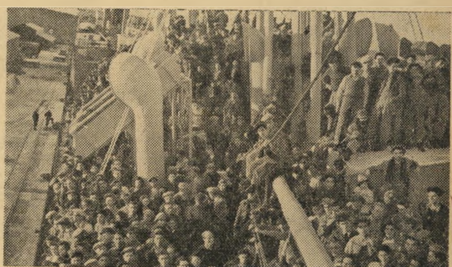
התזות ברוסיה: עליה ממזרח אירופה.

המסקנה: אדם הרוצה כי מדינת ישראל תצ"ט טרף לגוש הסובייטי, חייב לתת את קולו לאחת משתי המפלגות הדורשות זאת: מק"י או מפ"ם. אדם הרוצה כי מדינת ישראל תצטרף לגוש האמרי-קאי, יכול לבחור בין כל שאר המפלגות (מפא"י, פרוגרסיביים, דתיים, צ"כ, חרות) אשר ההבדל היחיד ביניהן, מבחינה זו, הוא הבדל של הדגשה וניסוח.