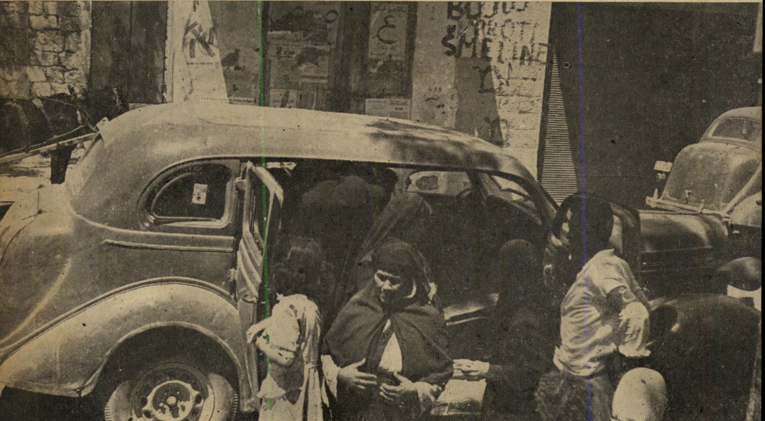
כל הרכיבים — לקלפי. מפא"י ורשימתה הערבית ("ע") דאגו לכך כי איש לא ייעדר. כאשר סדני ברית פועלי ארץ ישראל (נושאי סרטי זרוע מצויינים ב"ע" ערבית) לא הספיקו לגייס את הבוחרים, נעזרו, כמפלגה היחידה בין תשע המתחרות, במכוניות. המשא העיקרי: נשים רעולות שהצביעו לפי הוראות בעליהן או אחיהן.