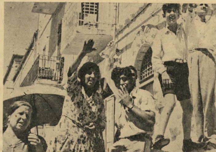
הקרובים ממתינים ליד מעבר מגדלבאום, ירושלים פקידים, קרובים, סתם סקרנים

"הצבא הישראלי מונה הרבה מאד חיי-גיוס אשר מספרם יכול לעלות במקרה של גיוס כללי. אולם היחסים המתוחים בין ישראל ושכנותיה הערביות לא יאפשרו שום שיתוף פעולה בהגנה משותפת של המרחב. להיפך, קיימת האפשרות הרצינית כי ישראל תצטרף לסובייטים ברבע שצבאותיהם יפלו למרחב..."