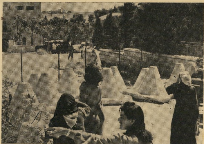
גדר התיך המפרידה בין מדינת ישראל וממלכת הירדן נשנה אותה מחזה

של הצלב האדום שביקרה במקום. ואמנם, מצבם טוב באופן יחסי. הם לא ויתרו על תקוותם לשוב לבתיהם, אך מוכנים לחכות, אם יש צורך, עשרים, שלושים שנה. "אין כל ספק שנצור", הם מוכנים חים איש את רעהו, "כי סוף סוף נזרק את היהודים לים ביום מן הימים".