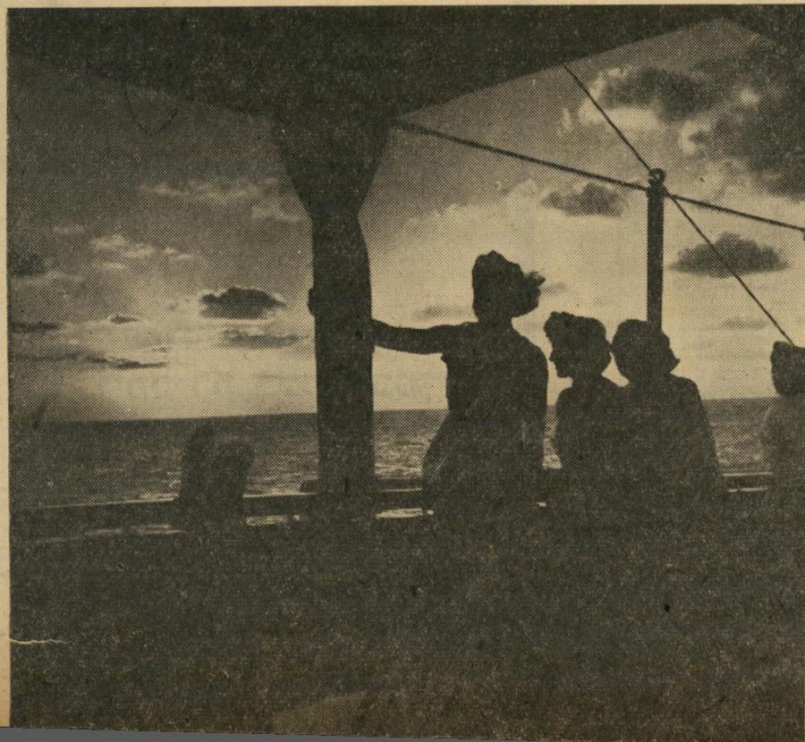
ים, שמים, יין, מוסיקה. כאן אין צנע. האיש שקיבל מנת בשר בלי נקודות (מימין) ושאל בהלצה אם אפשר לקבל תוספת, גלגל עיניו בהפתעה כשנענה: כן, בבקשה. אחרי "תה של שעה חמש" מסורתי, מנגנת התזמורת על הסיפון, — אפשר לרקוד. שקיעת השמש באופק הופכת את הים למפה ורודה ומשרה רוח של רומנטיקה העושה מכל אחד דון'דואן.