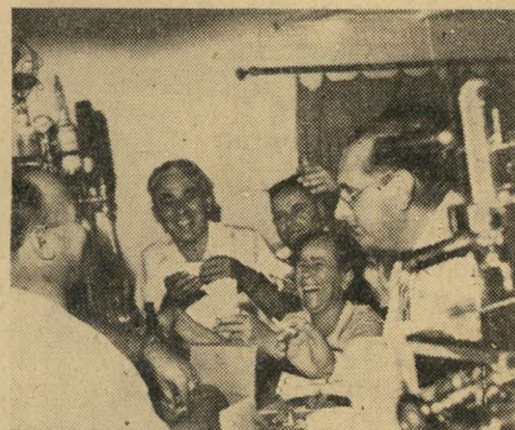
עינין של מצב רוח. נדחקים מסביב לדלפק לקנות שוקולד (ליצוא בלבד). אולם אחת (לפחות) אינה הושבת על שוקולד.