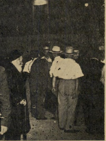
הדלת הסגורה: משרד הבחירות בשעה 8,05 ויכוחים לרגלי המדרגות

הבסיס לשמועה: עיתון התנועה, הי-דוע, מפרסם תמונה של אנשי תנועת החירות, כשהם עומדים סביב שולחן קלפי, ויש להם ביניהם חברים מן המפלגה הבריטית.