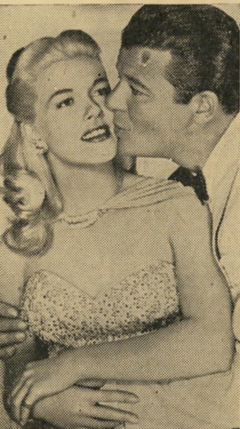
ג'ק קארסון, דוריס דיי

החוף הנספיק (274 ע') — ישראל זרחי ראובן סט (750 פרומטה). ישראל זרחי היה בן 23, כאשר החל לומד ספרות באוניברסיטה העברית. תוך זמן קצר השתלט על הלשון העברית, וב-15 שנות חייו הנותרות (הוא מת בגיל 38, בשנת 1947) הספיק לפרסם 15 ספ' רים, בשיעור של ספר לשנה.