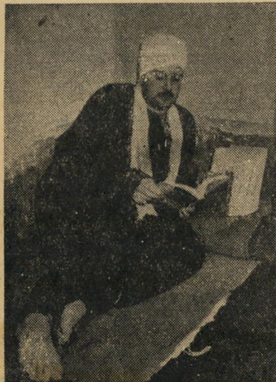
מהפכני. רצח את כינדאר באשא, אחד מאנשי המלך פארוק החשובים.

עתון אחר הרוצה לשמור לעצמו זכות' יחיד בפרסום ידיעה כה חשובה, אנו מרשים לכל הרוצה להביא סיפור זה בפני קוראיו להעתיקו. יהיה זה רק פרי' סום הנצחון הלבנוני הראשון שארע מזה זמן רב.“