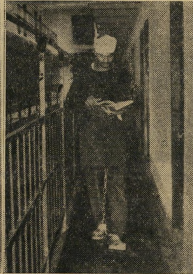
לאומני. סטודנט לכלכלה, רצה לפוצץ את בנין הפרלמנט המצרי.