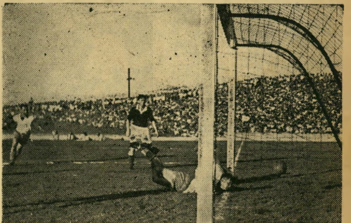
השער הראשון: גלור על הארץ הדירה מסורפת

נקבע שם מיוחד והשמות לבדם היה בהם להבהיל: תעלת השמן, מורד כו-סילות, בקעת-יזראב, מעלה העקרים, מושב זקנים, סביבון, מורד נוף, תל-מסילות.