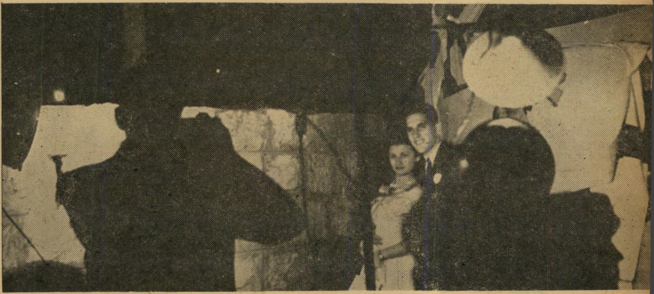
מזכרת נצה. לעמוד ולהסתכל בזוגות המצטלמים — תענוג כפני עצמו. פוזות, העוויות פנים, אופני עמידה מיוחדים ומגוחכים לכל אדם ואדם. באלבום המשפחתי תיכנס התמונה תחת הרייטינג: "היו זמנים". פעם יראה אותה הצעיר לבנו ויספר על לילה נעים ומשעשע.