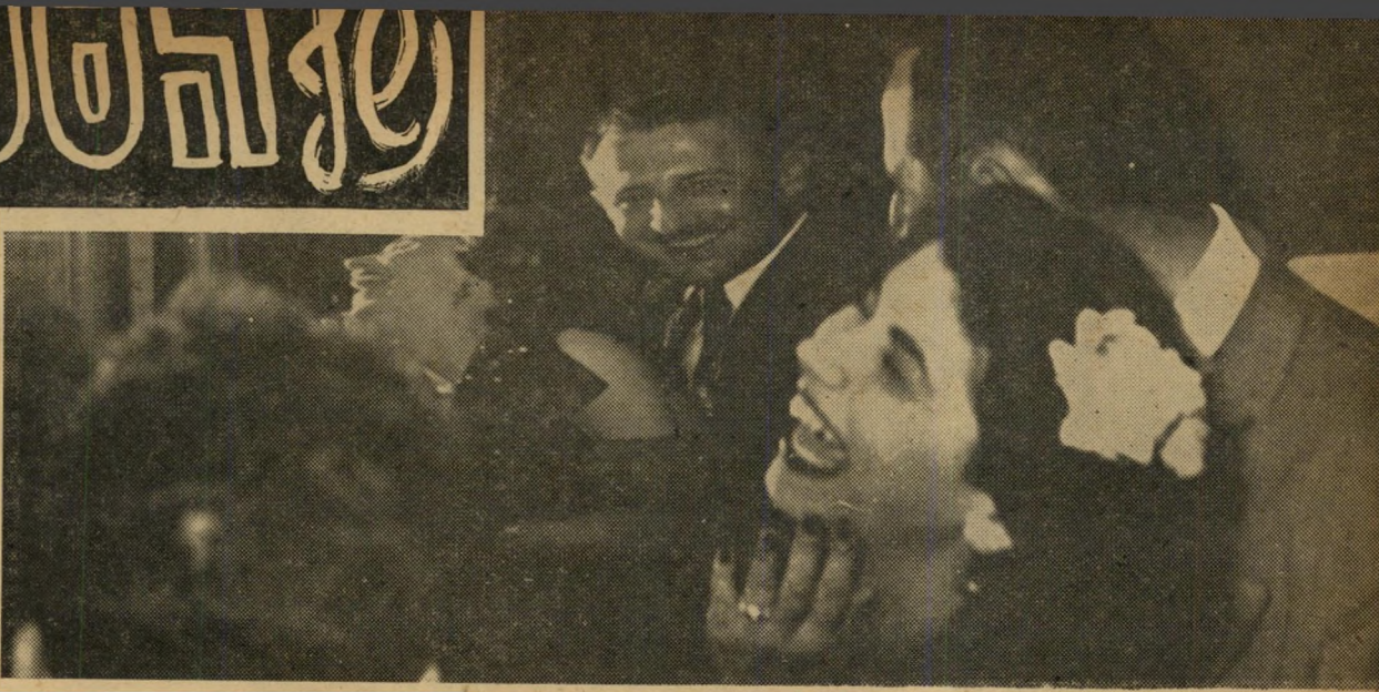
אוהל המראות. בחוץ משדר תקליט צחוק מדבק, בפנים, מול המראות העקומות, הופך כל אדם דו־פרצופי, מעורר את צחוק הנדחקים מטיב. צעירות יפהפיות מקבלות פרצוף־בלהות; איש שמן כמעט התעלף, כאשר ראה לפניו את הגשמת חלומו — בראי הופיע איש דק וארוך, ממש אתליס בעל גזרת אליל. אשה שמנה, שעמדה מן הצד, התעודדה ואמרה לבעלה: "לדירתנו נזמין ראי כזה."

מן הרגע הראשון ניכר הארגון המצויין. המשתתפים לא ויכלו לאכול, לשתות (אם לא שכחו להביא ערימה של כסף). לרקוד, להגריל, לירות ברובי אוויר וקשתות, למנהרות בלהות. מי שלא חפץ לצחוק, הוכרח לצחוק תקליט, ששידר צחוק אוויר ופרוע. "מה דעתך על הנשף?" שאלו אנשים איש את רעהו איש ענה לפי דרכו; אחדים טענו, שהשטח הגדול, הגבוהים הבהילום. הכל תלוי במצב רוחו של כל אחד לארגן מצב-רוח. "חייבת הייתי להביא נעלי מסע, לא נעלי נשף," טענו. "כשעמדת במקום אחד, חשבת שאני מפסידה משהו אחר. הסתובבתי סחור סחור כל הערב."