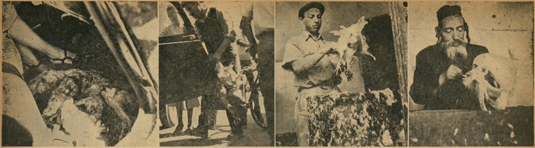
שוק שחור! כך חשב גם צלם העולם הזה, כששוטט בשוק הכרמל וראה את הגברת במכונית המהודרת, "אוספת" תרנגולות בקרקעית מכוניתה. כבלש חרוץ עקב אחריה, הקשיב לשיחה — עד שנתקבר לו, לאנכבתו, כי הגברת נטושה לקרפוט הדיפלומטי, רשאית לאסוף תרנגולות דיפלומטיות, ככל העולה על רוחה. אבל חבל היה על התצלומים — המון תרנגולות!