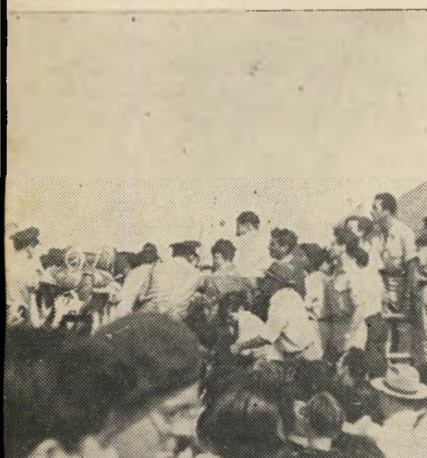
מועבר דרך ההמון הנרגש

חזר בקור. אחד העתונים, שהקדישו מאמר מקיף ורציני למסע, היה העתון הבריטי בעל ההשפעה העצומה, אקונומיסט. העתון משבח את המדינה, את הממשלה, על מפעל קיבוץ-הגלויות; קובע, לאור התקן ציב כי עליה של 150,000 יהודים בשנה הקרובה תעלה את הייבוא ב-10 מיליון ל"י. אם מכירת אגרות-העצמאות באמריקה לא תכסה סכום זה, תפשוט המדינה את הרגל. בכל זאת מצויר העתון תמונה אופטימית: הארץ דינמית, נולד בה עם חדש. האוירה