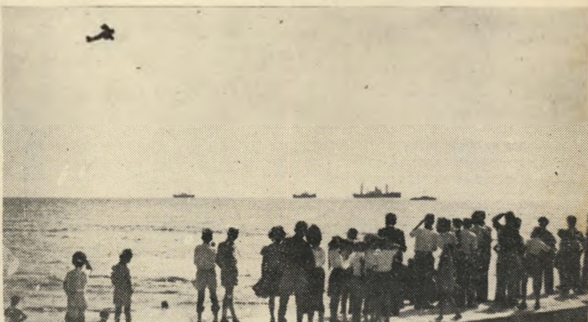
רגע אחרון: המטוס מתכווץ לצלילה הגורלית