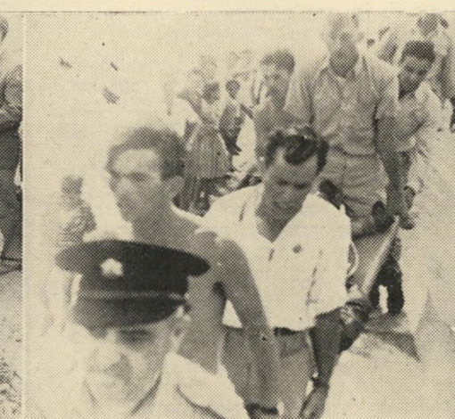
הטייס מועבר באלונקה לאמבולנס