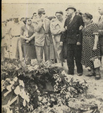
הקבורה: האב השכול וחזרים