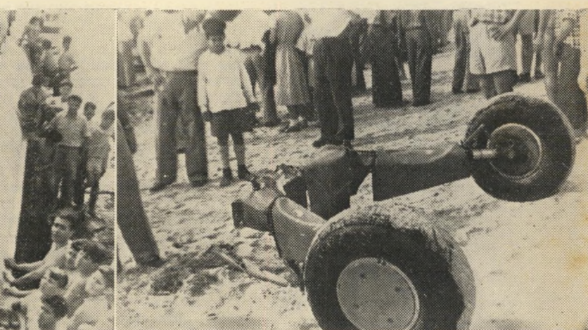
הגלגלי המטוס צפו והגיעו לחוף

בישראל טובה מזו השוררת בארצות השכנות. לעומת זאת: היהודים אינם מסוגלים, כדרכם, להבין את נקודת-הראות של זולתם, אינם מתכוונים ברצינות להגיע לידי שלום עם הערבים. בגלל המחסור בנסיעות לחו"ל, בסד פרים, בעתונים הם חיים בגטו סגור. הסיכום: אגרות החוב יכולות לסתום לשנה-שנתיים את החור בקיר, אולם אין הן מבטיחות קיום יציב למדינה אם לא תשיג שלום עם הערבים.