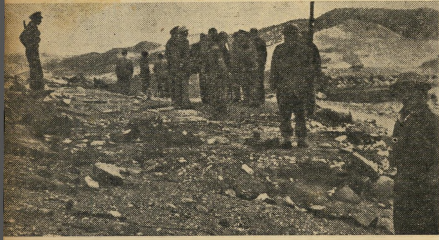
פצצה תבערה ישראלית נפלה במקום הזה והרסה צריפון קטן