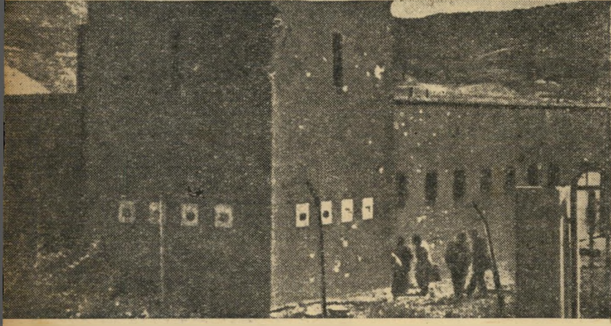
תחנת המשטרה שידדה אירעה התנגשות הצבא הפורו בשוטרים הישראליים (למעלה). למטה: סיור בחזית, שנערך ע"י הסורים לעתונאים הזרים