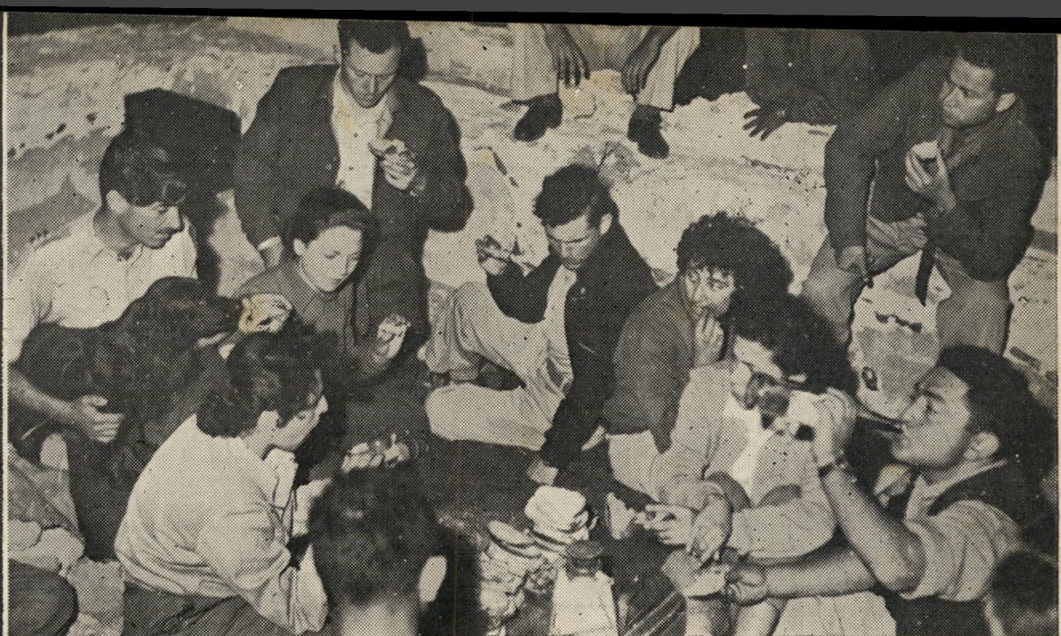
מטבח מודרני. במרכזו של המחנה נמצאת חורבה. כשעלה הירח, ישבו כולם מסביב למדורה לטעום משלל הציידים.