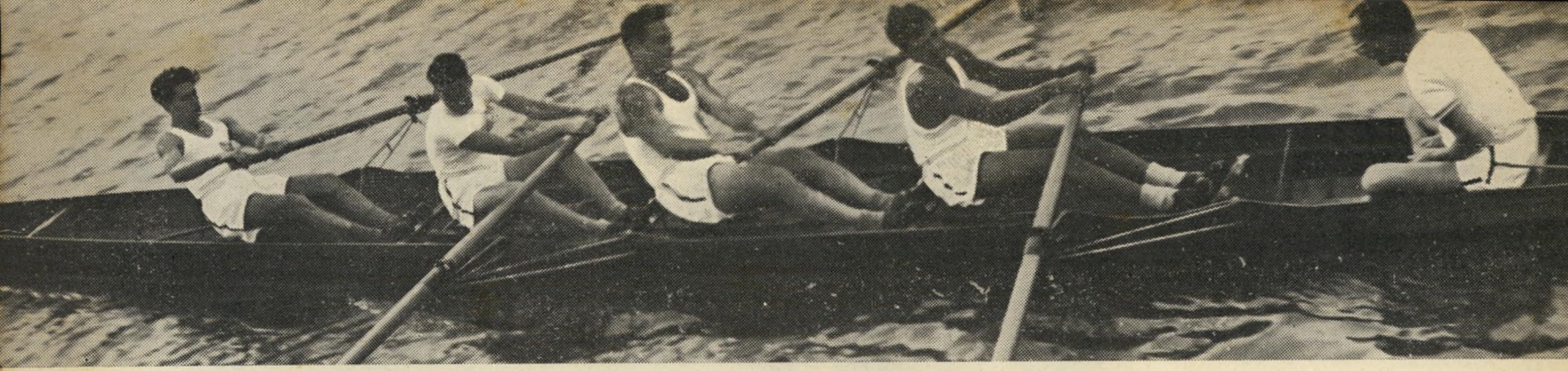
הקבוצה שהפסידה: תמונה המבליטה היטב את אי התיאום והקצב הנקוי — סיכות הכשיון. במקום אבא עשיר, קליפות תפוזים.