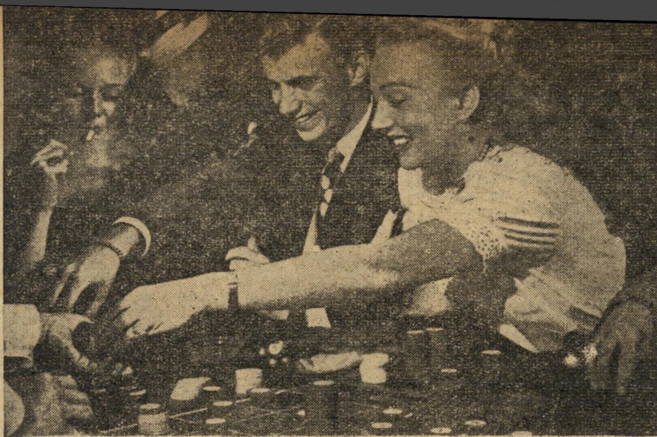
בריודז'נרו מתעוררים תושבים רבים רק בערב - למלא את בתי השעשועים.

בתי השעשועים וההימורים נפתחו בשמונה בערב. לבי בוד הקהל שאינו רוצה לבקר בתי אמרן או לשמוע קונצרט. צלילי ה"תזמורת הדרום אי מריקאית מתערי בים בנקשת הדיסקיות הצבעוניות הנערמות על השי מיה הירוק של שדי הז'וזט; העינים עוקבות בהרדה אחרי הכדור המסי תוכב סחור סחור במטרת המספרים. המפסידים מקוים שהסיכוי הבא ישי נה את מזלם; הז'וזט מתייבש וז'וזט הים את הדיסקיות הצבעוניות - פיזום או דיוני