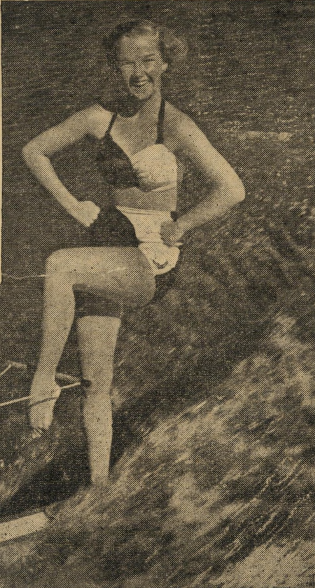
בקצה השני של העולם נצלים האנשים בחום השמש - מי בתענוג ומי בעמל.