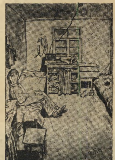
מעון המשוחררים, שיוך מונים העסק רק מתחיל

חייו של האורח נעשו אפורים, הוא מתחסן לאט לאט נגד כל הפתעה. עתה דר' אג האדם הקטן, כיצד יקיים את המצוה "ושמחתם בחגיכם". מנת המצה הובטחה. יתכן שיהיה גם יין לארבע כוסות. אנני רות הביצים לקראת החג נסתיימה, כפי