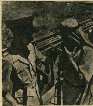
פגישה בנכוד מוריה * בביתה, טיפות דם