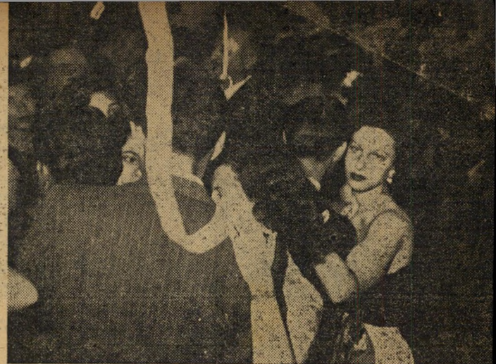
ג'אז עצוב: כולם מרגישים בעומק ליבם שחסר משהו. התזמורת מנגנת, הרגלים רוקעות ורוקעות, אולם מצב-רוח אין. מדוע? איש אינו יודע.

א היה זה פורים שמתי. ההמונים הסתובבו ברחובות, חסרי תכלית, צופים בדאגה איש אל פני רעהו, שמא יגלו בתצחוק על שפתיהם. אולם הצחוק אבד. איש מבני תל-אביב אינו זוכר פורים כה עצוב. גם בימי הקרבות, היה מצב-הרוח כיום זה מרומם יותר. לפחות הילדים צהלן. אולם הפעם נדמה שגם הילדים, בתחושיהם הבלתי-משכנעות, התאמצו כדי לצחוק. תירוצים היו לרוב. בימי הצנע קשה היה להתחפש. כוכבון של זיקוקין די נור, הדוקק 10 שניות, עלה 60 פרוטה. אולם אלה תירוצים. לא התחפשות, לא המחירים, לא הצנע היו יכולים לשמש מכשול, לוא היתה באמת שמחת חיים מתפרצת. אולם זו האמת העגומה. המדהימה כמעט, של יום פורים תשי"א: בשנה השלישית למדינת-ישראל אין זכר לאותה תודת-חיים צהלת.