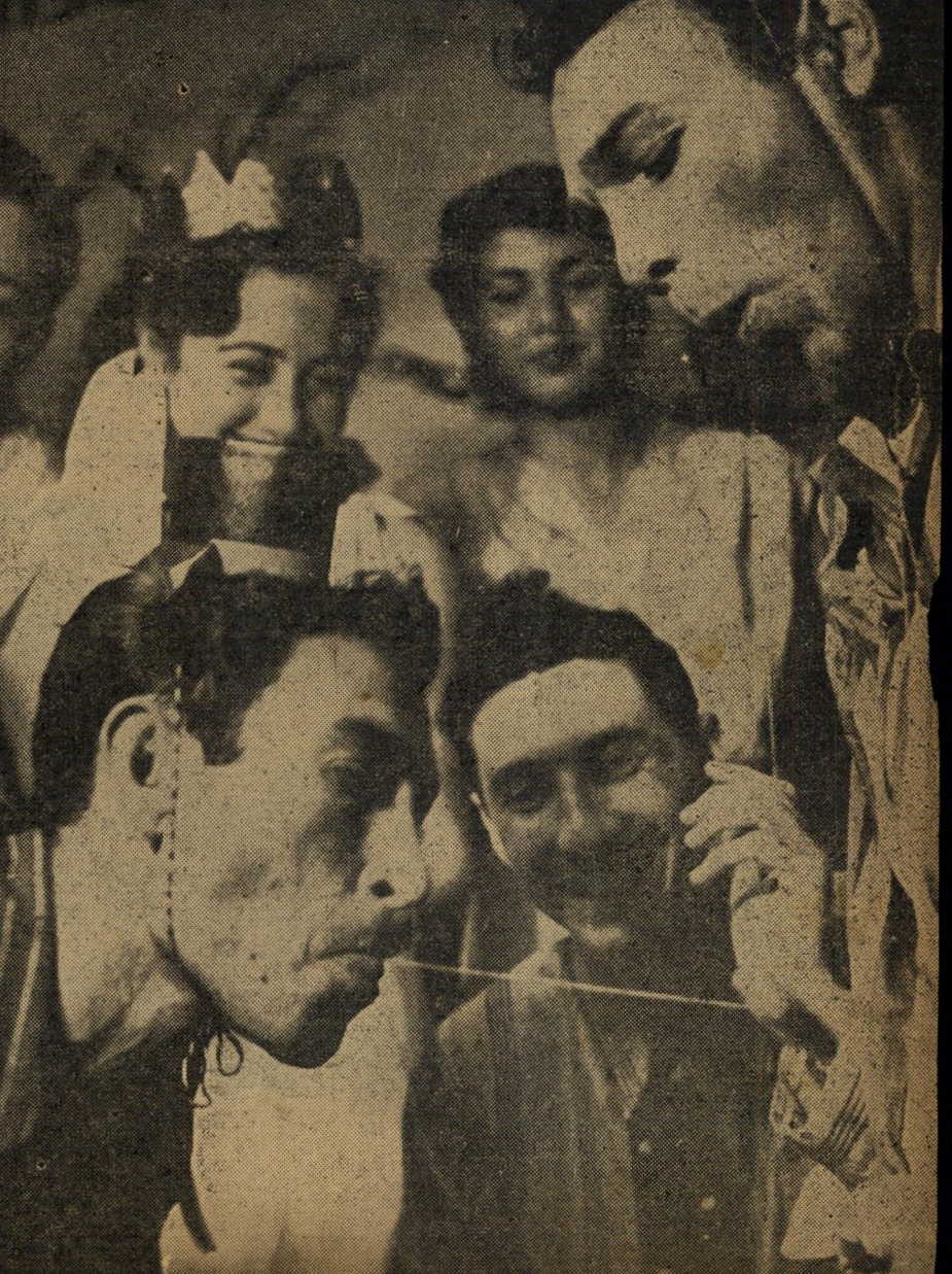
התחרות המכרעת: מי ירוקן ראשון צלחת בירה כדרך החתולים. מתיחות על