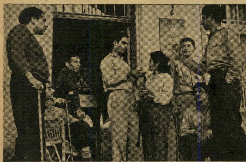
הנכים בבית הבק, נס ציונה לפצועים, רופא נשים

בחצר מספר 4, ברחוב מקוה ישראל, מול החלון המסוגר, שחם בפני אדם את אפש יות ההצלה, עמדה אחת מפקידות המשרד ובכתה חרישית. "משה היה הבחור ההגון