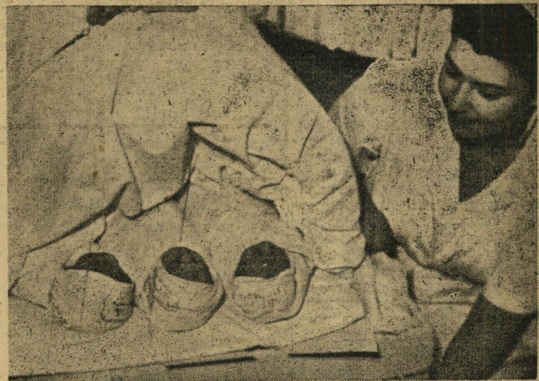
אשכנזי מס' 5, 6, 7 לאב, פנים חזורים

הופכים עד שבא פנחס והוציא לשוק, אולם כוחה של החזית הדתית עודנו איתן. הקצבים, הכשרים" נענו לכרוז הרר בנות הראשית, טרבו לשחק את השימור רים באיטליוניהם. משרד החקלאות לא אמר נואש ופנה למשווקי הדגים. אבל התאחדות הסוחרים אמרה "לא!" לא ניצור תקדים להכניע ענף אחד בעזרת ענף שני; כלומר, אולי יודמן עוד פעם להכריז על שבתת