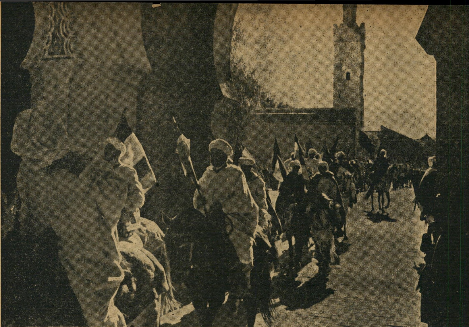
ידידי צרפת. טור של 2,500 פרשים ברברים חמושים ונושאי דגלים צרפתיים, שעבר ברחובות פז, כאזהרה לתושבי העיר הערביים. הסימא: „הפרד ומשול“