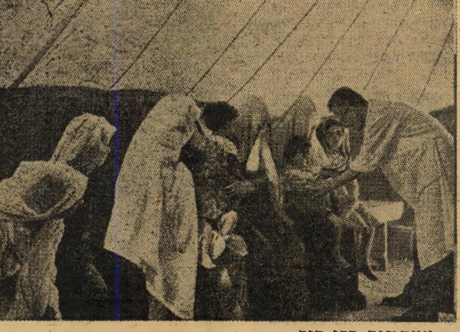
ממתנינים בלי סוף. חיים של ניוון ואפט מעשה מעיקים על יושבי המחנות. הגברים יושבים באבק וזומומים מזימות או מחפשים פרנסה, והנשים ממתנינות באהלי האימיניסטיצה לטיפול רפואי, או לקבלת לחם חסד. עתה הבטיחו לישיבם בסיני ומקוותיהם תלויות בחסדי מצרים.

כל נסיון של שלילת זכותם הדמוקרטית כעם חפשי לגול חשיש.