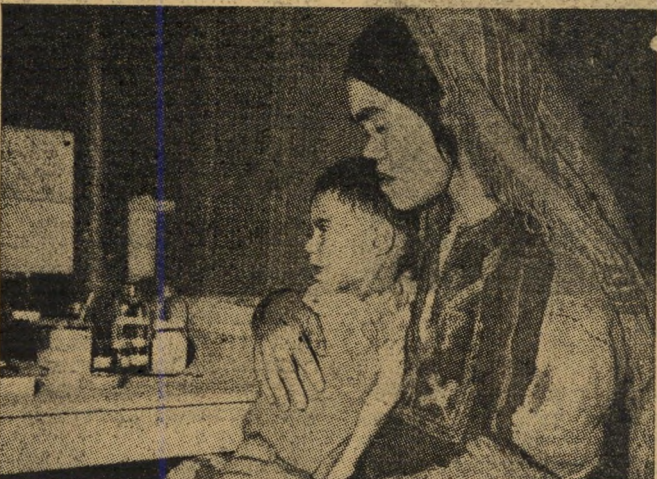
היגיינה אלמנטרית. היא פלחית, בת פלחים, ומעולם לא שמעה אלא על הרפואות הפשוטות ביותר. עתה משתדלים רופאים מתנדבים ללמד את אמצעי השמירה על החיים והבריאות, שערכם במחנה כאפט.