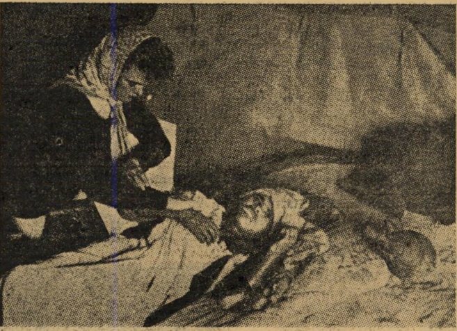
חולה שחפת. פליט צעיר זה, נגוע ריאות, מוסיף רק למטריות הוריו. לא מעטים מבין הפליטים חיו לפנים בתנאים שהיו, אם לא מזרחיים, הרי לפחות יותר נוחים מתנאי המחנות האיומים והמנוונים.