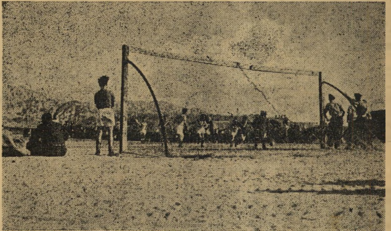
צפון נגד דרום, אילת לא הצליח, הדרום

האסיאדה הראשונה. כאשר הוכן האיצטדיון ותוכנו ההופעות והתחרויות