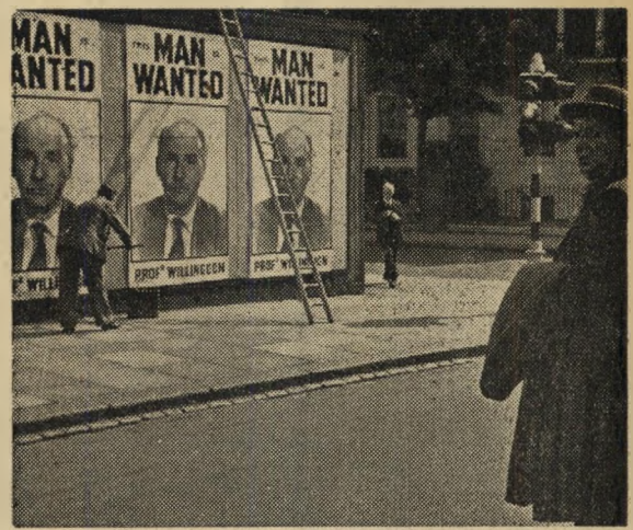
7 ימי חרדה: הפרופסור והמודעות הקהל נמתח

הסרט מתעלם לחלוטין מבציה זו, ומכל בעיה רצינית אחרת. ראש-הממשלה הבריטי, המקבל את האולטימטום של איש-המדע (להכריז מיד, כי בריטניה תחדל לייצר פצצות-אטום, אחרת תופצץ לונדון) אינו חושב אף רגע קט על הצד המוסרי של ההצעה. בין מיליוני האזרחים, היוצאים מערים (בשקט מופתי, ללא בהלה, בסדר ובמשמעת) אין איש אחד המאמין כי הפרופסור צודק.