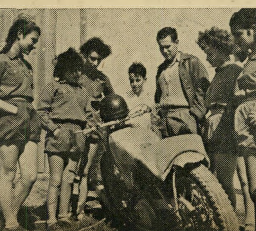
שופטים, תפוס מקום! אות הזינוק ניתן. הקיבוציניק הממונה על הקסט, "כרבולת" שולף את עפרונו, מוכן לחלק נקודות.