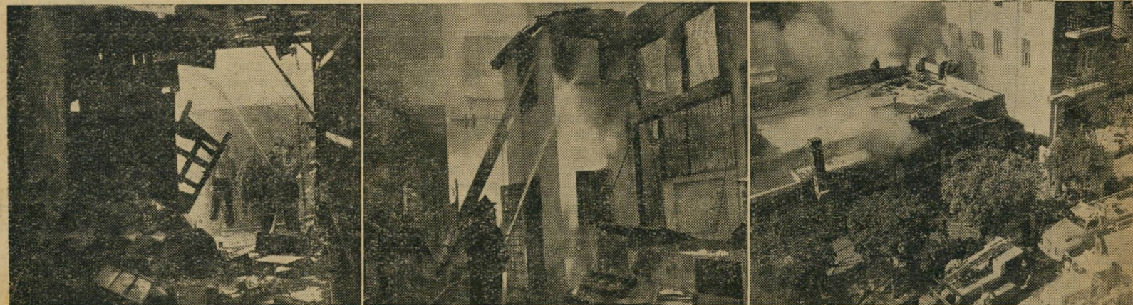
השריפה באלנבי 74: חנויות בני, מצקין וליהמן עזות באש גם לא אהבה יפאנית