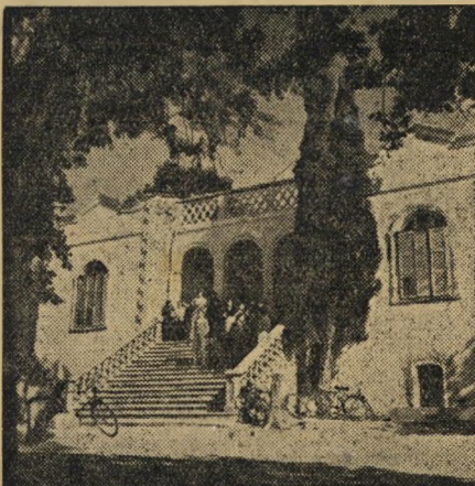
בית ה"ס התיכון ברחובות, איחוד זרם הכללי וזרם העובדים, אירח את הכינוס עמים זרים.

לפני למעלה מ-27 שנה, בשנת 1923, ישבו כמה מחנכים וחיברו תכנית למען תלמידי "כנסת ישראל", ש"היתה אותה שעה עדה קטנה. התכנית ביטאה את רוחו של קיבוץ אוושי קטן, התלוי כולו ביהדות הגולה, בעל אפקים צרים. כמו כל ע"מיעוט במדינה זרה, שמה "כנסת ישראל" בלי מודיה את הדגש על הלימודים, שטיפחו רוח לאומית קיצורית, והניחה את הלימודים המקנים השכלה כללית, אר"ן פק רחב והבנה של עמים זרים.