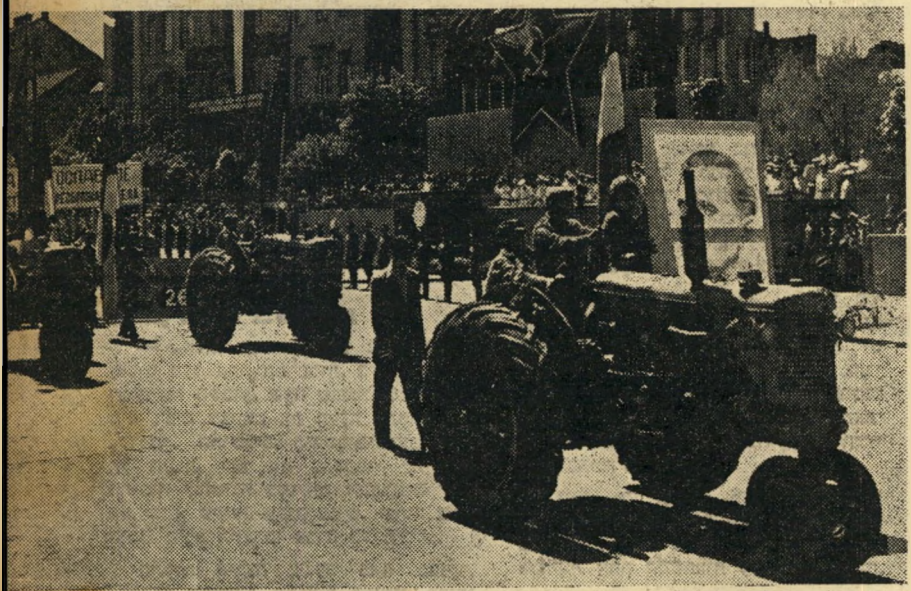
"תוצרת יוגוסלביה": לפי "תכנית החומש" של טיסו, מקריבה הארץ קרבנות עצומים כדי להקים תעשייה משוכללת. טרקטורים אלה יוצרו במחיר לחם ובגדים. אך הם יוצרו.