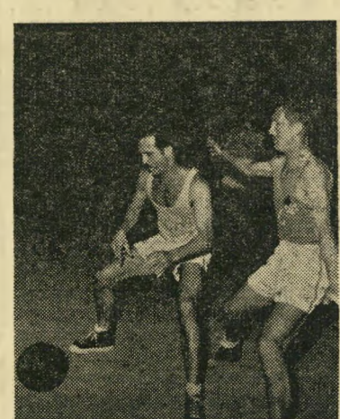
קורמן, גרבי, עז יד הכדור להרוג זמן

פאול אחר. לוא היה אותו שחקן "מכבי" תל-אביב חושב, מה עלולה לגרום פגיעה אישית אחת, היה נמנע לעשותה. מצב הנקודות היה שווין ברוך — 34:34 השח קנים והקהל התלהבו עד כדי היסטריה. כל מקרה פועט גרר צוחות וצעקות עד לב השמים. לא ברור אם התזה, פאול" מקרי, או זריקה בלתי מדויקת לכוון הסל; השח קן הצעיר, של "מכבי" תל-אביב, איפשר לאריה איסרוב לירות זריקה חפשיה, להע"לות את מאזן הסלים 34:35. בקבוצתו