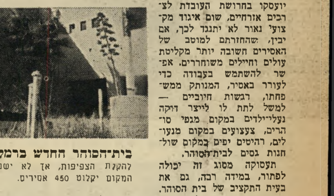
בית-הסוהר החדש ברומה: בעוד שנה יגרום להקלת הצפיפות, אך לא ישנה את המצב בעיקרו. המקום יקלוט 450 אסירים.

כלכלתו בבית-הסוהר (כדי למנוע את ההרגשה שהוא חי על חשבון הזולת), בשליש השני הוא יכול לקנות לעצמו מצרכי-מותרות מסוימים בקניינה של בית-הסוהר (סיגריות, עוגות, משקאות לא-אלכוהוליים, פיגמה, עוננים, ספרים, וכדו'), ואילו השליש השלישי שמור למענו בקופת בית-הסוהר, ונמטר לידו ביום עובו את המוסד. חסכון זה יאפשר לו למנוע את חבלי הקליטה בחיים אזרחיים.