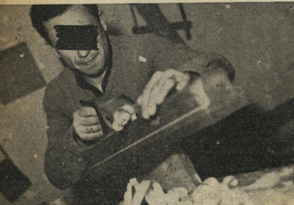
הנכרחה של בית-סוהר יפו: אחד האנשים המעטים העוסקים בעבודה פוריה בבית-סוהר ישראלי, כדי למנוע התנוונות, יש לקיים בתי-מלאכה נרחבים יותר.