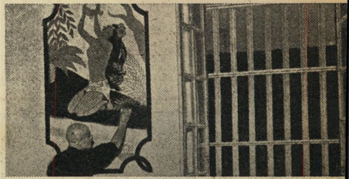
חיים פרטיים בתא: דוגמה לשיטה המתקדמת באחד מבתי-הסוהר הצרפתיים החדשים, המאפשרת לאסירים להשתמש בכשרונותיהם, כדי ליפות את טביבתם. בצורה זו אין האסיר מאבד את גאוותו האישית ואת הנגוע עם החברה.