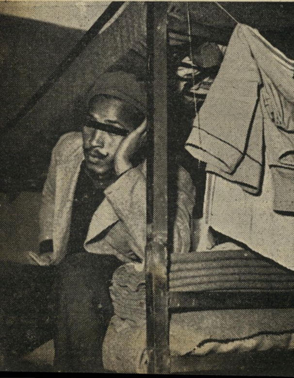
יוג עיניים פונה אל החברה: האם תמשיך החברה לדון את אסיריה להתנוונות ולהשפלה, או שתיתן להם אפשרות לשנות את דרכם באוירה החפשית של בית-סוהר מתקדם?

סיפור זה מטיל אור (או צל) על אחת הבעיות הכאובות ביותר: שיבתו של האסיר אל החיים האזרחיים.