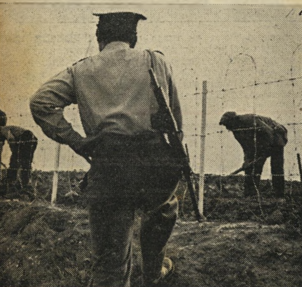
עבודה בגינת-הירק של בית-הסוהר בתל-מונד: הגינה הקטנה חוללה שינוי רב באווירת בתי-הסוהר.