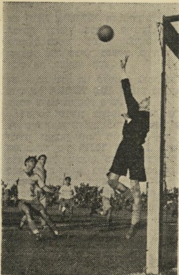
גזור את גזור מסתערים לטופים בידיים

סחורת ייצוא ללא קופצים. אם כי טרה התאמה בקרב הנבחרת מ"גל אביב, הרי הנצחון על האורחים מלמד שאין הם מצטיינים. היו כבר בארץ קבוצות מעולות יותר, אך השוויצים אינם מתרוממים מעל הדרגה הנהוגה בישראל. קבוצת "מכבי" תל-אביב, בהרכב טוב על-לה לכנות את האורחים שוקיע-לירך ואין צורך להשיג דוקה נצחון משפתים. אין ספק, שמהירותם של השחקנים, שליטתם על הכדור, תנועות גופם המטעות והקונדיציה הגופנית שלהם עלו על אלה המר קומיים. אך כדי להגיע למסקנה זו אין צורך להביא שחקנים משובי הרחוקה ואף שר להסתפק בקבוצות התורכיות השכנות מצפון. מי שאינו מסתפק בסיבה זו יסיימלמה.