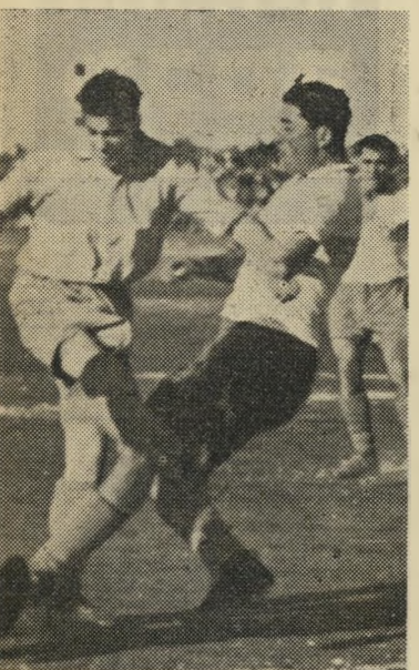
מלמד (ימין) וחוקי לואוואן פניעות ברגליים

השוטרים הפסיקו לרוץ אחרי גנבים ופתחו במסע נגד הכדור. הליגה לכדורגל המקיפה 7 נבחרות ממחוזות המשטרה תעניק לאלוף גביע הנושא את שם המפקח הכללי של המשטרה, בינתיים צועדים בראש התל-אביבים, כשברשותם 5 נקודות. הצבא הצרפתי זרזו יותר מהצבא לכדורגל, ולפי הזמנת מרכז "הפועל" תבוא במחציתו השנייה של חודש מרץ קבוצה צרפתית (נראה שזרם האמנים הבא לישראל קסם גם לאמני-הכדור). הכדורגלנים הפעם הם חילי-הצבא, שהקימו נבחרת ראווה לשמה. הצרפתים ישחקו ב"קהל" במסגרת המשחקים על גביע הים התיכון והם יסורו לביקור בישראל.