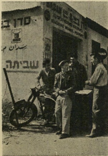
מפעל מתכת, שביתה

הציונים הכלליים ינסו לתפוס את מקום מפ"ם בעת חלוקת התפקידים בוע-