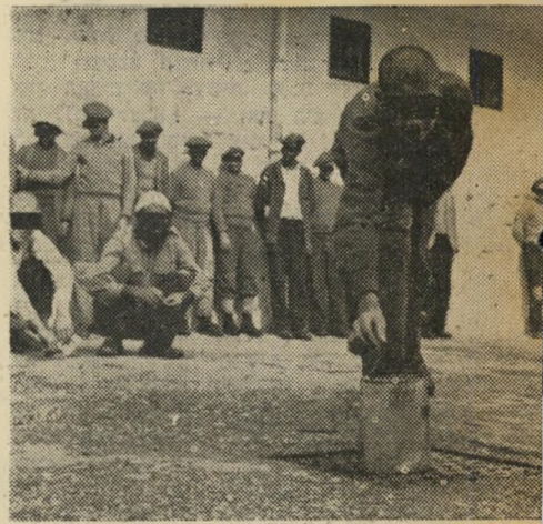
גריה (מימין) כורעים האסירים על הארץ, נשארים יטה כולה באה למנוע אותה לחלוטין.

תלונותיהם של האסירים עצמם נוגעות לרוב לפרטם קטנים. "מדוע לא נותנים לנו לעשן בתא, מתי שאנחנו רוצים?" שואל אחד מהם. ושני מתמרמר: "מדוע לא נותנים לאשתי לתת לי סוכריות כשהיא באה לבקר אותי?" תשובת הסוהרים: אם אחד יקבל ממתקים והשני לא, יגרום הדבר מריבות בלב שאר האסירים.