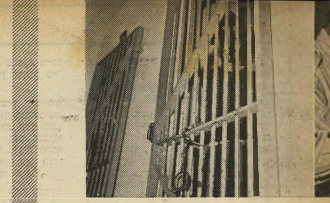
בת סגירות לתאים. מקרה יומיומי: סוהר מוצא אסיר מובא לדין לפני מנהל בית-הסוהר. העונש תזונתי עונשים והפקת הסיולים בחצר.

תא השפוטות: הצפופות אינה קטנה מאשר בתאי הגברים. בשני התאים של אגף הנשים גרות 9 אסירות שפוטות ו-4 עצורות. הנשים יש מרפאה נפרדת משלהן. תעסוקה: אפס. על המחלקה אחראית סמלת של השרות, כל השמירה בידי סוהרות הלבושות מדי חאקי.