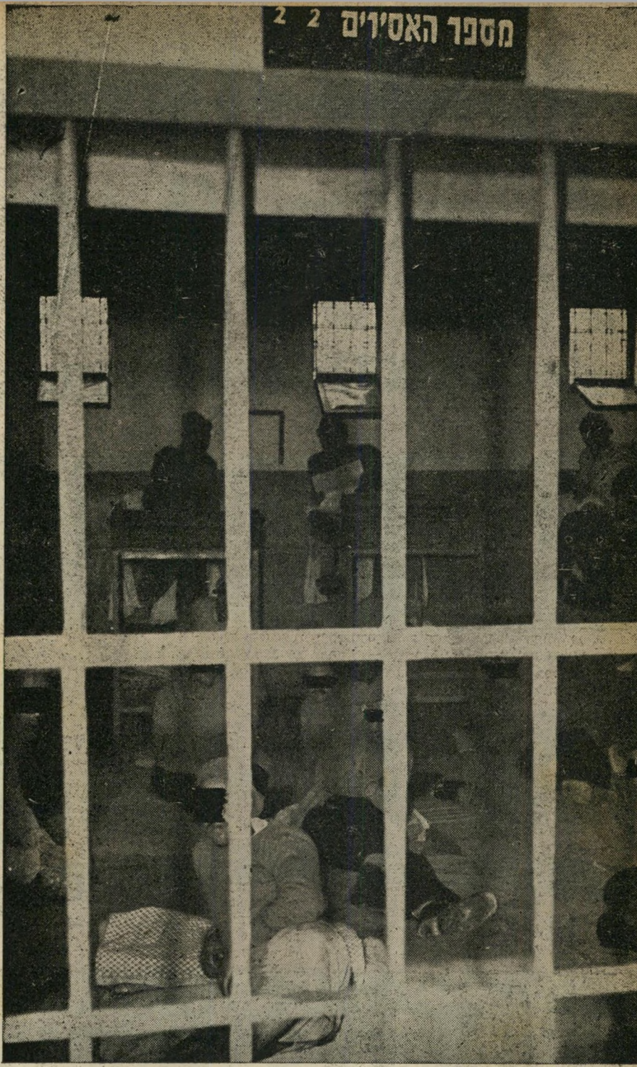
תא מספר 14, תל-מונד: תא זה נועד לקלוט 18 אסירים. למעשה, שוכנים בו, כעת, 24 אסירים בלילה, ואילו ביום מועברים אליו 24 אסירים נוספים, מן האגף השני של בית-הסוהר, שאין בו חצר לטיולים. רק לחלק מן האסירים יש מקום במיטות הקומתיות, התופסות כמעט את כל שטח התא, והשאר נאלצים להסתפק במזרונים המושמים בלילות על הרצפה והמועמיים ביום ליד הקיר. צפיפות נוראה זו שוררת בכל התאים ביפו ובתל-מונד. בתאים רבים חוסמים האסירים הישנים את הרצפה, או במיטות מתקפלות, את הדלת.