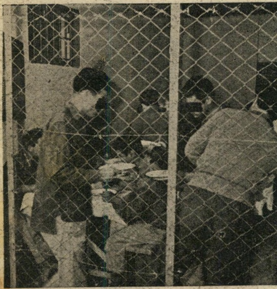
הקץ למרד השוקולד: הפעולה הראשונה של שרות בתי-הסוהר הישראלי היתה: חיסול התלבושת המשפילה של יטי המנדט. האסירים לובשים כיום סוודים ומכנסיים אפורים או מדי-קרב חומים רגילים.