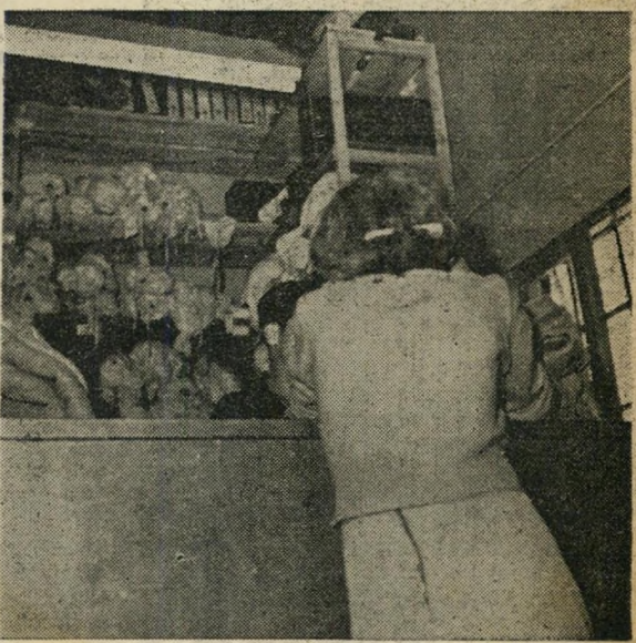
מחסן הציוד: זה עתה הובאה עצורה בת 17, הנאשמת בפריצות, לבית-הסוהר. היא מקבלת 3 שמיכות, מגבת, ספל וסבון. העצורים רשאים ללבוש בסוהר את בגדיהם הפרטיים עד בירור דינם.

כולטים בחברת האסירים המדים האדומים של האסירים, שניסו אי פעם לברוח מבית-הסוהר (הבאים להזכיר לסוהרים שיש לשים עליהם עין במיוחד) ורטטהורוץ של האסירים, אשר מתנהלת נגדם חקירה נוספת בקשר לעבירה אחרת. האדומים האמיתיים — הנדונים למוות — אינם באים במגע עם שאר האסירים. הם חיים בתאים נפרדים בבית-הסוהר המרכזי, בתל-מונד, ומטיילים בחצר קטנה מיוחדת להם.