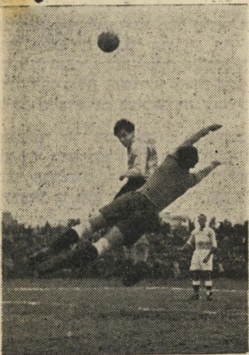
השוער בנדורי מתמתח

שהשופטים היו בשביחה. אך ביתנים הסתדרו העניינים בכי טוב (עד כמה שזה