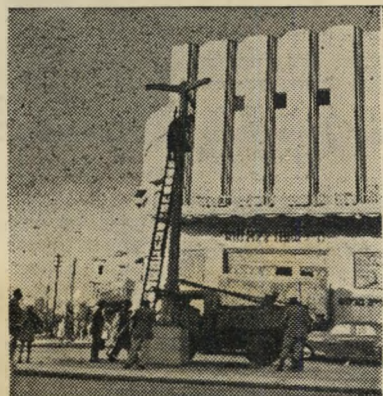
עמוד השעון הט נפגשו והתחננו

מישהו הלך, אמנם, וטילפן למישהו, אך עברה שעה ועוד שעה ולא הופיע אדם במקום, שיוכל לעשות דבר. קרוב לשעה 12 הגיעו מוסמכים והחליטו, כי יש להקל את סבלו של הסוס ולהמיתו. ירו בו וכנראה פגעו, אך הסוס לא מת, המשיך לסבול, שנת דם. לבסוף, אחרי איבוד דם רב, צנח ארצה והחל רועד. האנשים עומדים מסביבו ומביטים... קרוב לשעה אחת אחה"צ, הופיעה במ קום מכונית טנדר ועליה כותב "גן החי