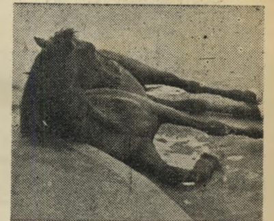
הסוס הפצוע הט עמדו והביטו

הבינו השוטרים כי המקרה שלפניהם הוא רציני ויש לטפל בו כראוי ולהביאו בפני שופט כדי שיקבע, שהאיש אינו שפוי בדעתו, ואז יוכל השופט לקבוע, שיש מקום לתת לאדם טיפול רפואי, היינו בית חולים. לא מן הנמנע שיימצא מקום במוסד — ואז יהיה הכל בסדר והאיש בלי שם ובלתי כתובת יקבל במקום שם — מספר, וכתבתו תהיה: בית החולים. צריך היה להביא את האיש בליישם בפני שופט והנה הוא מסרב להתלבש.