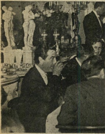
רוברט טיילור להתבודד בחווילה הפרטית.

לפני הפליגו לאירופה, לקבל עליו את פיקוד הצבא האטלנטי, נבחר דרויט