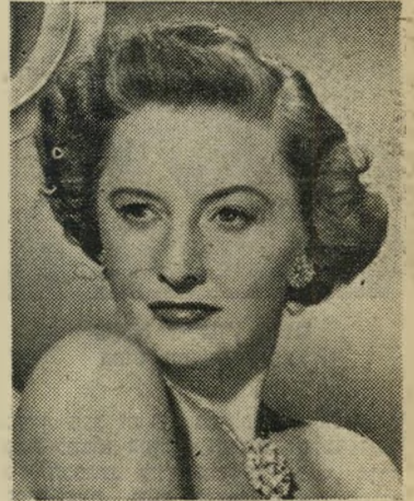
ברברה סטנוויק אנה פניך מועדו

באותו שבוע נולד באותו בית חולים (אסותא ת"א) בן בכור לח"כ אחר, יריבו של אורי צבי גרינברג, לנתן