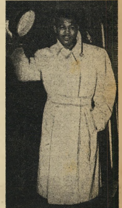
"סוכר" ריי רובינסון לאשה: 140 תקליטים

בשבוע החולף הסכימו העתונאים הצר-פתיים, שנוסף לשיירה הכבודה, היה רר בינסון לוחם ראוי לשמו, שהפיק כל מה שאפשר מ-155 הליברות שלו. בשרשרת קרבות רצופים הכה הכושי את כל מתני גדיו בנוק-אאוט. את האלוף האירופי הק-דם במשקל בינוני (162 ליברות) - ג'ין טטיק - הכה "הסוכר" תוך שני סיבוי-ביים (אגב, קרב זה מוצג עתה ביומני הקולנוע בתל-אביב). עוד לא הספיק ריי לנצח בפריס וכבר נע לכוון בריסל, ואף כאן חזר על אותה התמונה: הקרב נגד האלוף הדולנדי במשקל בינוני - לוק ואן דאם--