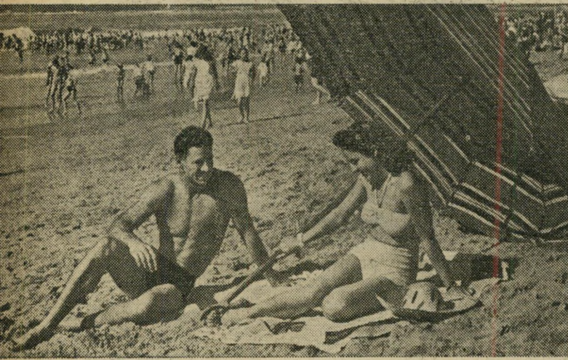
ארץ האושר וחדוות־החיים. כך מכונה דרום־אפריקה בחוברות התיירות. ואכן, אפשר לחיות כאן חיי אושר ומותרות — אם עורך לבן.