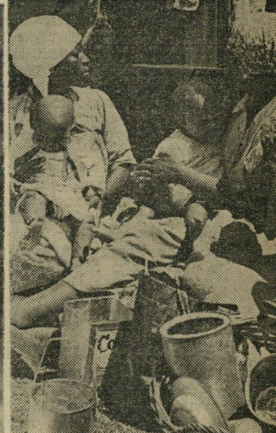
הזהב השחור של אפריקה. אחד ממקורות עושרה של דרום־אפריקה הם מכרות הזהב הגדולים. אולם עוד יותר מהמתכת הצהובה, מכניס החומר הגלמי השחור — הכושים. הם עובדים במכרות בתאים מפריכים, חוצבים מן הטלע את עושר אדמתם, למען יחיו אדוניהם.