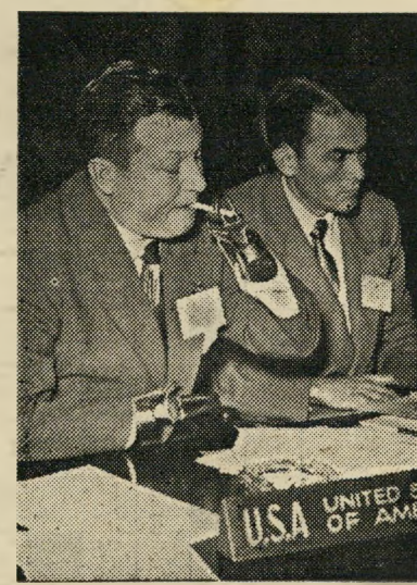
מן הכר אה החיים: הרולד ראטל, הגיבור הנידש של "שנות היינו היפות ביותר", ייצג את ארצות הברית בכינוס הבינלאומי לשיקום נפגעי המלחמה הנכים.

אחרי שיושלם הסרט יוכלו להדפיס פר' סומים אמנותיים. זה בודאי יתן סיפוק לסקרנות הקהל אם יפורסם בקרוב, כי תפקיד הרוסי ניתן בידי שחקן ישראלי. שיטת הצילום: לסיים את כל הסצינות במקום מסוים. למשל, כל הסצינות בחדר המדרגות כבר צולמו, ואין זה חשוב אם