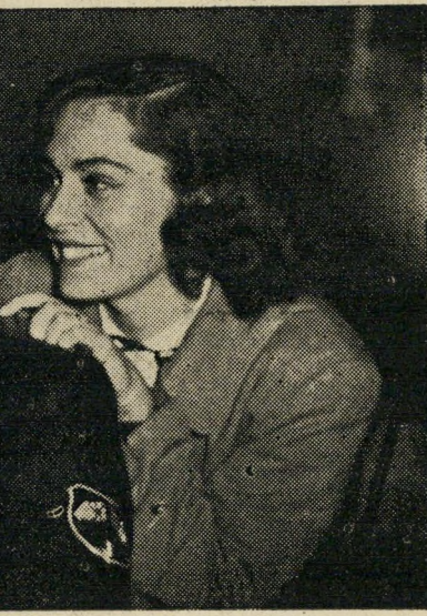
יוסי ידין ויוויקה לינדפורס (4 על גיפ") האשה מחכה.

התפקיד הראשי הוא בידי ויוויקה לינד' פורס — כוכבת קולנוע שבדית שנתפר' סמה בהוליבוד מאז המלחמה. שאר ה' שוטרים הצבאים הם באמת אמריקאי, אני גלי וצרפתי — שחקנים בעלי שם בארצם; תפקידו המשנה בידי שחקנים וינאים מער' ליב, יוסי הוא היחידי שלא הופיע לפני כן בסרטים.