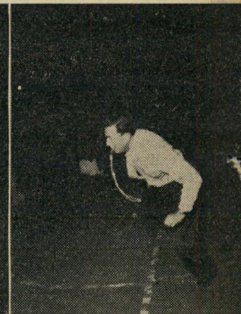
אל תתיאש הכיכבי! ההתקפה נס' תייתה, אך המישחק רק מתחיל. שחקני "הפועל" שבים למקומותיהם על המגרש.