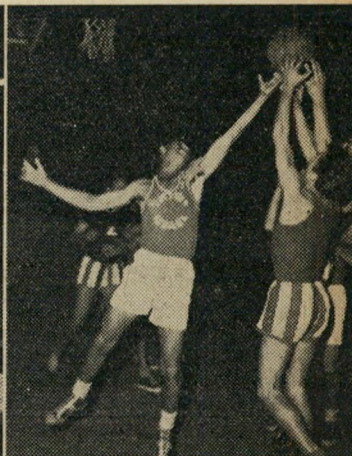
הכדור לא נכנס. הזריקה שבאה ללא הכוונה החטיאה את הסל, אך החי' לוג' מזנק, והכדור שוב עולה אל סל.