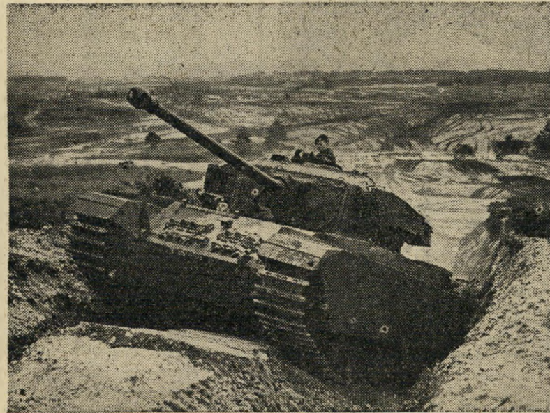
ה"צנטוריון" החדש בתמרין מוד פואץ העצמאות נשכחה בדרך

בשכוע שעבר, החליט ודרו ויאט, חבר בית הנבחרים הבריטי, כי מצרים אינה יכולה להחשב ככתב-ברית נאמנה, ודרש כי ממשלת בריטניה תפסיק למכור נשק למצרים; הצעד הראשון: ביטול חוזה המדי-כירה של 16 טנקים חדשים מסוג צ'טוריון, שעמדו להמסר למצרים. כך דרש ודרו ויאט.