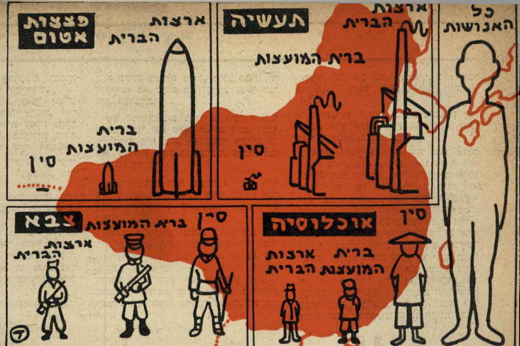
המפעמה השלישית הגדולה: העם הגדול ביותר בעולם בעל פוטנציאל תעשייתי כמעט אפסי. רגליים מול מכונות. זה המראה המוכר לאירופים. אולם סין אינה שאננה.