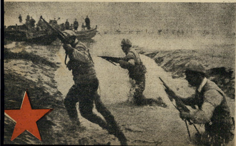
הפנים אל פרימוזה: באי התבצר צייאנג, הגנרליסימו העקשן. מנוי וגמור עם מאו לגרשו. אולם לפני צייאנג התיצבו אניות-הקרב של מאקיארטור. צבא המליונים וצי הגונקות (סירות סיניות), כבש את כל האיים הקטנים בדרך (בתמונה) - אך לא יכול לעוצמה הימית האמריקאית. התשובה היתה אופיינית למאו: קוריאה. חזיל המליונים הופעל בחזית היבשה.

זהו מטוס אמריקאי מסוג ס' 48. הוא הובא לראשונה לסין כחלק מהעזרה האמריקאית לציאנג-קאי-שק. כאשר נחלטו הלאומים אה"כשת, נשאר מטוס זה תקוע באוסן. עתה הוא עשיר את הרפובליקה הסוית העממית.