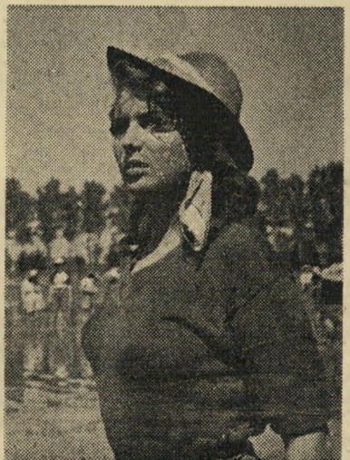
סילבאנה מאניאני (האורז המר) גוף מטוכן וזוג מטפריים

הסרט הזה חורג מן המסגרת המקור- בלת של סרטים סוציאליים; הוא איננו מתמר לחשוף את האמת של החברה ה- אנטישית כולה, או אפילו מן החברה ה- ארגנטינית, אלא אך בחייהם של שני טפו- רים יחידים: גבר ואשה, באי כת שני הקצוות של החברה. הגבר — פועל מוכשר